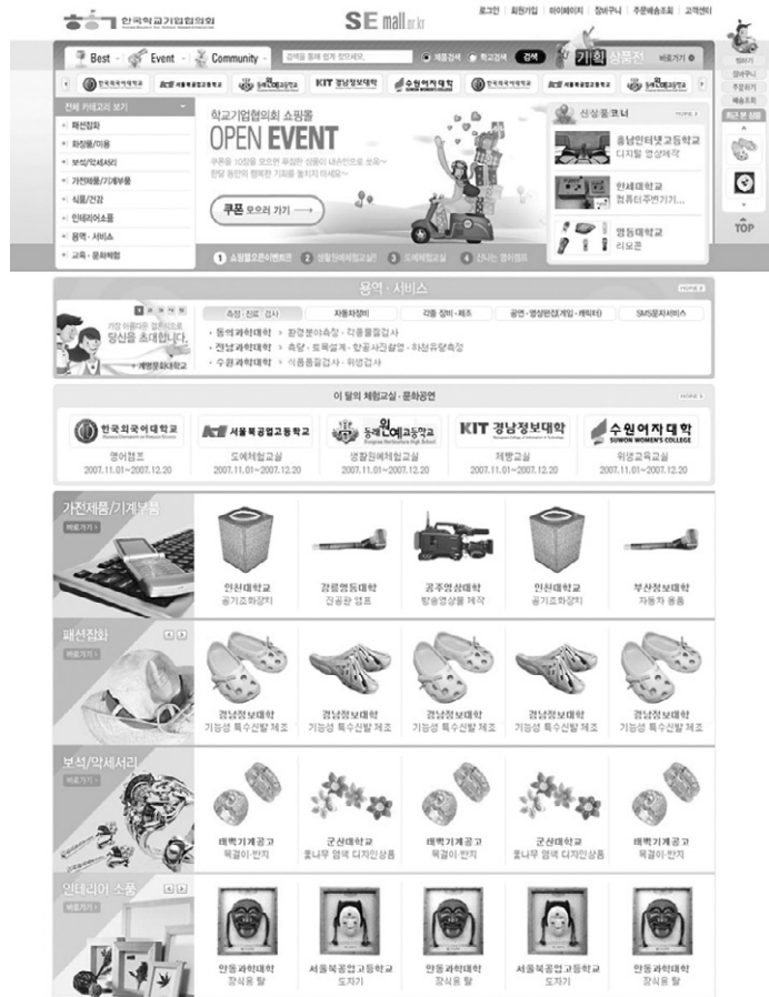
그림 1. 온라인 쇼핑몰 '새물(semall.or.kr)' 메인 페이지