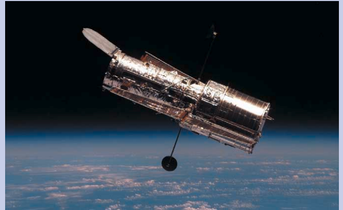
우주왕복선에서 촬영한 허블망원경

ACS는 2002년 3월 미 우주왕복선 컬럼비아호 승무원들이 장차 한 최첨단 카메라로, 전자 카메라 3대와 자외선부터 적외선 부근에 이르는 파장의 빛을 감지할 수 있는 필터와 광선분색기로 구성돼