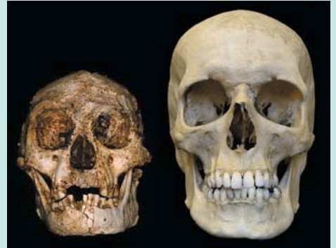
호빗족(왼쪽)과 현생인류 두개골

을 현생인류 정상인 10명과 소두증 환자 9명, 왜소증 환자 1명의 두개골과 비교한 결과 소두증 흔적은 전혀 발견되지 않았고 다른 어떤 인류 종과도 다른 독특한 특징을 발견했다고 밝혔다.