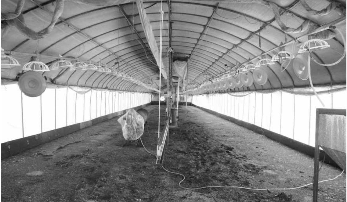
▲출하이후 깔끔히 청소하여 다음 입주를 준비중에 있다. 명성농장은 보온덮개 계사로도 우수한 사양성적을 보이고 있다.

독을 실시하여 계분처리는 일정기간 발효시켜 4~5회전 정도 깔짚은 추가하여 사용하고 이후 계분을 처분하고 있다.