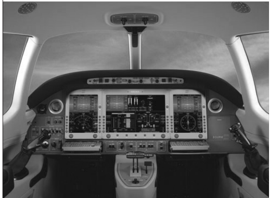
2개의 주비행 디스플레이(PFD)와 1개의 다기능디스플레이(MFD)로 구성돼 있어 시스템 제어는 물론 엔진 및 각종 비행관련 정보가 이곳에 시현된다.

생산 초기 에이비다인社(Avidyne Corp.)가 디스플레이와 소프트웨어를 공급했지만, 올해 3월부터는 IS&S社(Innovative Solutions & Support), 셸턴 플라이트 시스템스社(Chelton Flight Systems), 가민 인터내셔널社(Garmin International), 하니웰社(Honeywell), PS 엔지니어링社(PS Engineering) 등으로 구성된 새로운 팀이 이를 공급하기 시작했으며, 이들을 통합한 아비오 NG(Next Generation) 항전장비들이 2007년 여름부터는 본격적으로 이클립스 500에 탑재되기 시작했다.