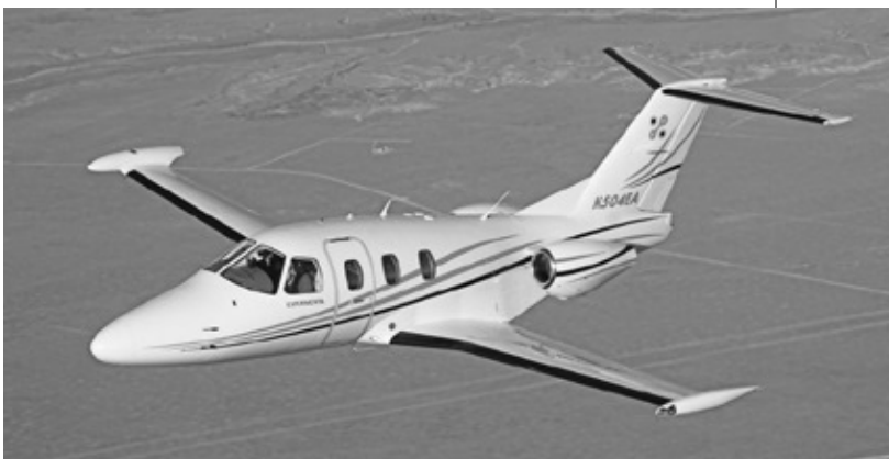
이클립스 500의 최대 순항속도는 370노트, 분당 3,424피트로 상승할 수 있으며, 높은 고도 및 온도에서의 운용은 물론 저고도에서의 연료효율성도 뛰어나다.

독창적으로 설계된 쌍발 제트기 이클립스 500은 운용효율성은 물론 안정성과 성능을 모두 고려한 초경량제트기(VLJ: Very Light Jet)이다. 최대 순항속도가 370노트, 분당 3,424피트로 상승할 수 있으며, 높은 고도 및 온도에서의 운용은 물론 저고도에서의 연료효율성도 뛰어나다.