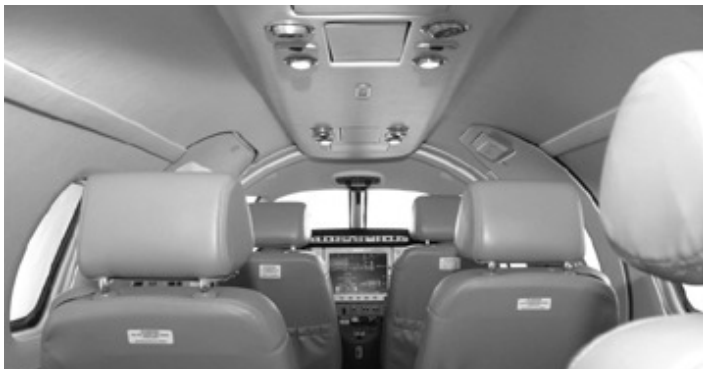
이클립스 500의 환경제어시스템의 특징은 조종석과 객실에 대해 별도로 온도를 제어한다는 점이다.

산소시스템(Oxygen System)은 산소가 보관된 22입방피트의 실린더와 조종사 및 승객용 산소마스크로 구성돼 있으며, 객실여압장치(Cabin