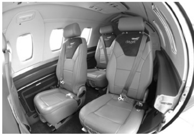
객실에는 4개의 가죽좌석을 비롯해 LED 조명, 우드트림 및 테이블, 전원 출력단자 등이 설치돼 있다.

소음처리가 된 이클립스 500 객실에는 4개의 가죽좌석을 비롯해 LED 조명, 우드트림 및 테이블, 전원 출력단자 등이 설치돼 있다. 또한 항상 쾌적한 객실환경을 유지하기 위해 디지털 객실 여압제어장치와 냉방 및 난방을 일정하게 유지하는 장치도 함께 설치돼 있다.