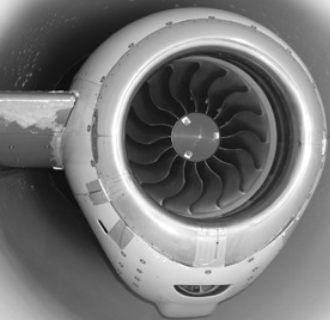
이클립스 500에는 프랫 앤 휘트니 캐나다社의 PW610F 터보팬 엔진이 2대 장착된다.

특히 이클립스 500에는 포스트렉스(PhostrEx) 엔진화재진압장치(Engine Fire Suppression System)가 설치돼 있는데, 오존층 파괴를 방지하기 위해 헬론 가스를 사용하지 않는다. 포스트렉스는 미 연방항공청으로부터 승인을 받았으며, 오존층 보호조약인 몬트리올 의정서 규정에도 맞도록 제작됐다.