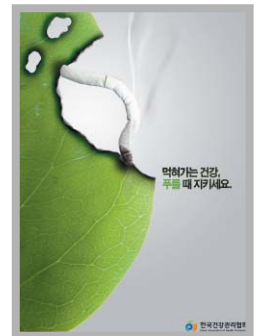
금연홍보 디자인공모 대상수상작 ▶