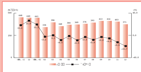
일본 IT 부품 · 소재 월별수입 추이

최대 수입규모를 차지하고 있는 IC(-1.0%)의 마이너스 성장과 더불어, 두 번째 비중을 차지하고 있는 기기부분품(-46.5%)이 큰폭의 마이너스 성장을 기록했는데, 주요인은 완제품 조립을 위한 후공정 분야의 해외처리가 증가하면서 마무리공정을 위한 기기부분품의 수입수요가 위축된 때문임. IT 부품 · 소재의 수입은 올해 4월부터 9개월 연속 마이너스 성장을 기록하고 있다.