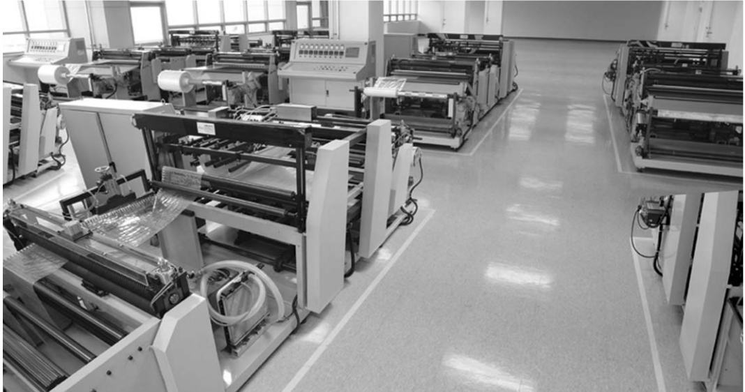
▲ 인디스에어 생산 현장

MATERIAL을 개발하고 특허를 취득, 공장을 시험가동하고 대만 시장을 대상으로 영업활동을 개시하게 된다.