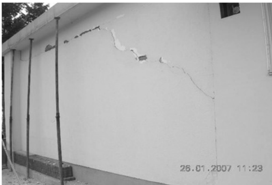
[사진 7-8] 진부면 거문초등학교 벽면 균열(진양지 남서쪽 약 9km지점)