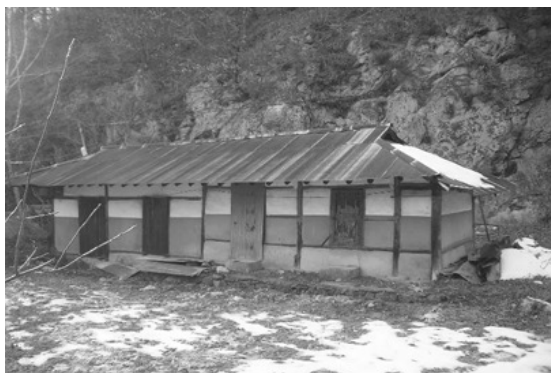
[사진 1] 진부면 가옥 피해 없음(진양지 부근)

피해에 그쳤다고 판단된다. 피해사례로 조사된 대부분의 건물은 노후정도가 심하거나 시공시의 결함으로 인하여 지진발생이 발생하지 않았어도 보수나 보강이 필요한 구조물이 대부분이었다. 구체적으로 열거하면 농촌과 산악지역의 대부분의 건물은 단순 조적식 건물로 노후정도가 심하고, 작은 횡력을 지지하기에도 힘든 건물로 골조사이의 흠벽과 유사한 단순채움의 형태로 시공된 것이며, 하부지반 지정의 상태 또한, 열악했을 것으로 판단된다. 지붕의 기와가 탈락된 주택의 경우는 기와와 기와를 연결하는 진흙덩이가 일부만 부착되어 있어 조그만 건드려도 탈락될 정도로 조사되었으며, 버스승