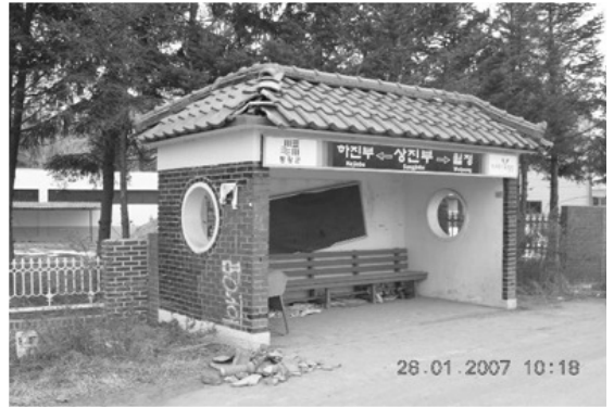
[사진 4] 진부면 버스승강장 기와탈락(진양지 남서쪽 약 4km)