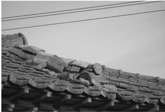
[사진 3] 진부면 가옥 기와 탈락(진양지 남서쪽 약 3.5km)

교 등의 조적조에 균열이 발생한 건축물의 경우는 조적조 사이의 채움 등이 부실한 상태에서 약간의 진동으로 균열이 진척된 것으로 생각된다. 초등학교 체육관의 천