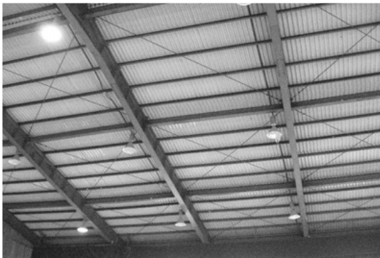
[사진 5-6] 진부면 진부초등학교 체육관 천정 브레이싱 파단(진양지 남서쪽 약 3km지점)