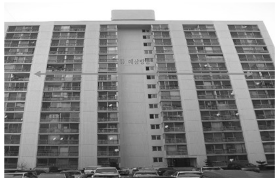
[사진 2] 강릉시 주공아파트 피해 없음(진양지 동쪽 약 30.7km)