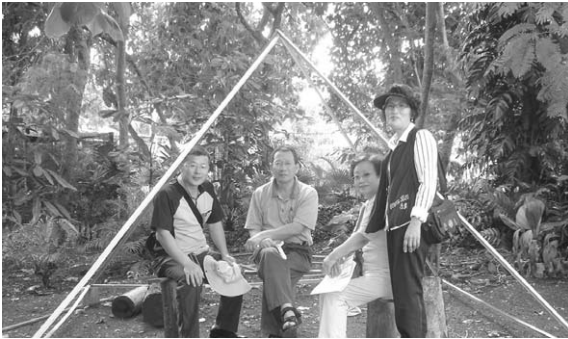
발아촉진을 위한 피라미드 농법