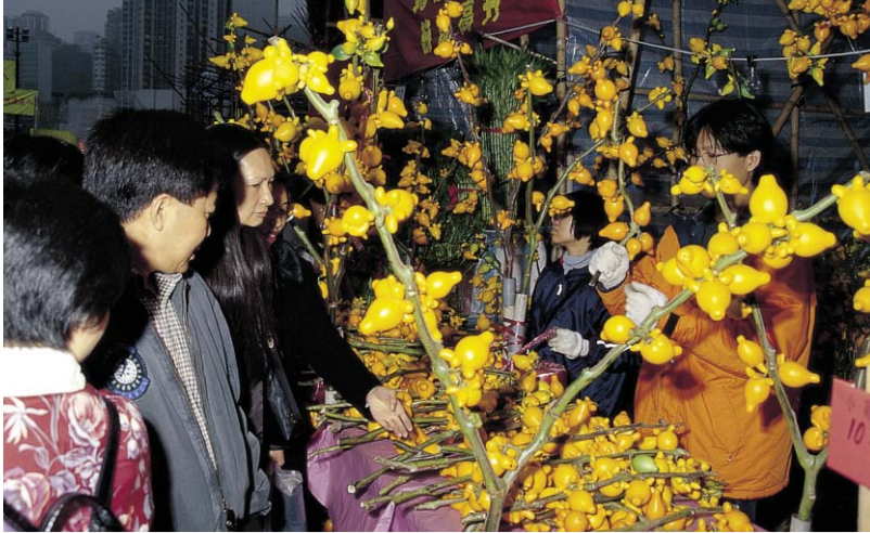
▲ 구정 전날 성대한 꽃시장이 열린다.