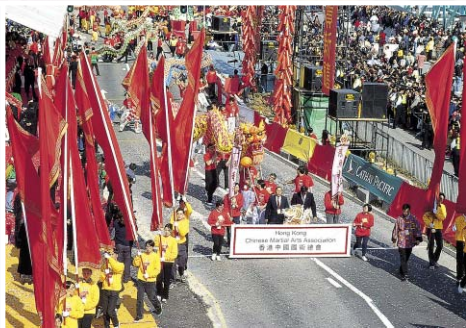
▲ 신명난 거리축제는 홍콩은 물론 여러나라에서 온 사람들이 참가한다.