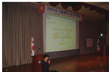
〈2007년 기술세미나 전경〉