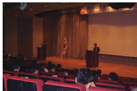
〈2007년 정기총회 전경〉