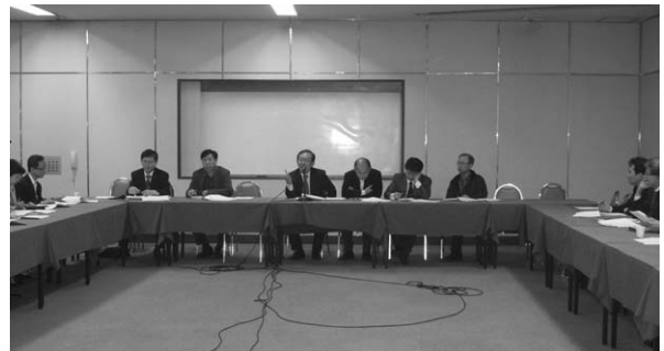
〈2007년 제1차 이사회〉