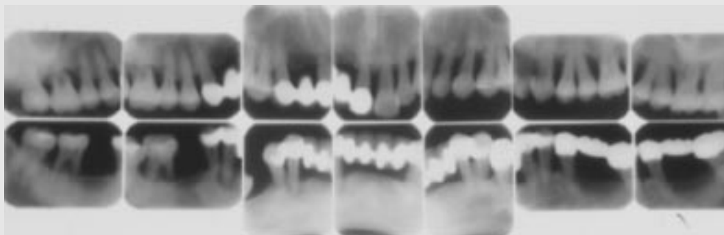
사진 2 21개월 후 구내 방사선 사진(1999.03.26).

히 닦아도 잘 닦이지 않는다고 답변하였다. 따라서, 환자에게 매일 내원할 것을 요구하였고, 환자는 이에 응하였다. 치주과에서 의뢰할 당시 동요가 있는 치아가 3도:3개 치아, 2도:3개 치아, 1도:9개 치아(지대치 포함)로 총 15개 치아(지대치 포함)이었다. 매일 정기적으로 치면세균막관리를 실시한 결과 27개월 후(총 26회 진료)에는 동요가 있는 치아가 3도:0개 치아, 2도:3개 치아, 1도:5개 치아로 총 8개 치아(지대치 포함)로 줄어들었다.