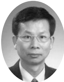
▲ 민방식 상무이사