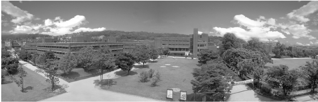
[덕성여대 쌍문동 캠퍼스 전경]

덕성여자대학교는 ‘브랜드 파워를 갖춘 여성 인재 양성’을 특성화 목표로 설정하고 ‘NEW UNIVERSITY 2020 전국 최우수 교육중심대학’이라는 비전과 ‘덕성을 갖춘 창의적 지식인 육성’이라는 교육이념을 구체화했다. 더불어 특성화 목표를 달성하기 위한 기본 전략으로 기초교육 특성화, 전공교육 특성화, 열린교육 특성화 3가지를 설정하였다.