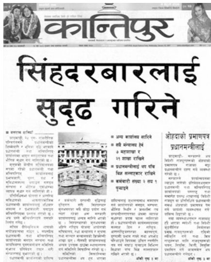
▲ 2007년 1월 10일자로 네팔 전국 최대 일간지인 '칸티푸르' 1면, 2면에 걸쳐 게재된 '덕성여대 2007년 네팔봉사대'의 우다칼가 중학교 봉사관련 기사