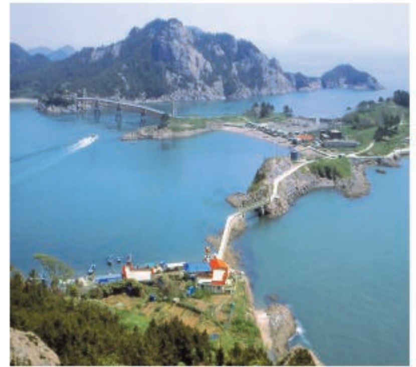
선유도 길(2005 입선, 박경남 작품)

한국도로공사에서 우리나라 도로의 우수성 및 아름다움을 발굴하기 위해 매년 전국민을 대상으로 공모 중인 '길' 사진전의 당선작 50여점이 전시장 내 E-cafe 및 휴게실에 전시된다.