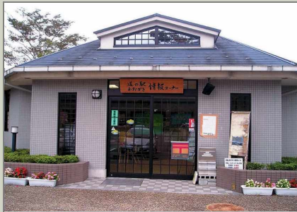
관광안내 및 정보관