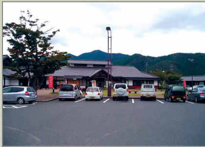
미치노 에끼의 전경

「그린벨트 아오가키(グリーンベル市)」가 있으며, 차로 5분 거리에는 단풍구경과 삼림욕을 하면서 맛있는 전통 음식을 먹을 수 있는 「코우겐지(高源寺)」가 있고, 산림 속에는 자연관찰과 자연과 교류할 수 있는 「아오가키 자연체험마을(市町村のふれあいの里)」이 있다. 그리고 차로 15분 거리에는 마을의 경치를 한 눈에 보면서 밧꽃 향기와 함께 스카이 스포츠를 즐길 수 있는 「이와야산초(岩屋山頂)」가 있다.