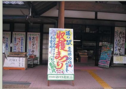
특산물 판매장 및 레스토랑