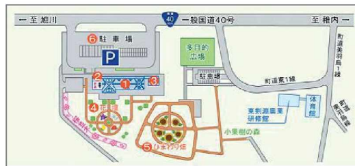
「그림책의 마을 켄부찌(繪本の里けんぶち)」의 배치도

특산품 전시·판매 코너에서는 현지 농산물을 이용한 켄부찌초의 대표적인 특산품을 모두 갖춰 놓고 판매하고 있다. 이 곳에는 켄부찌 지역의 전통 아이스크림(しそソフトクリーム)과 야채 주스 등이 유명하다. 농산물 직판소에서는 지역 생산자의 마음을 담아 재배한 친환경의 안심·안전한 농산물을 저렴한 가격으로 판매하고 있다. 그리고 레스토랑에서는 현지의 농산물을 이용하여 만든 차와 식사를 여유롭게 즐길 수 있다.