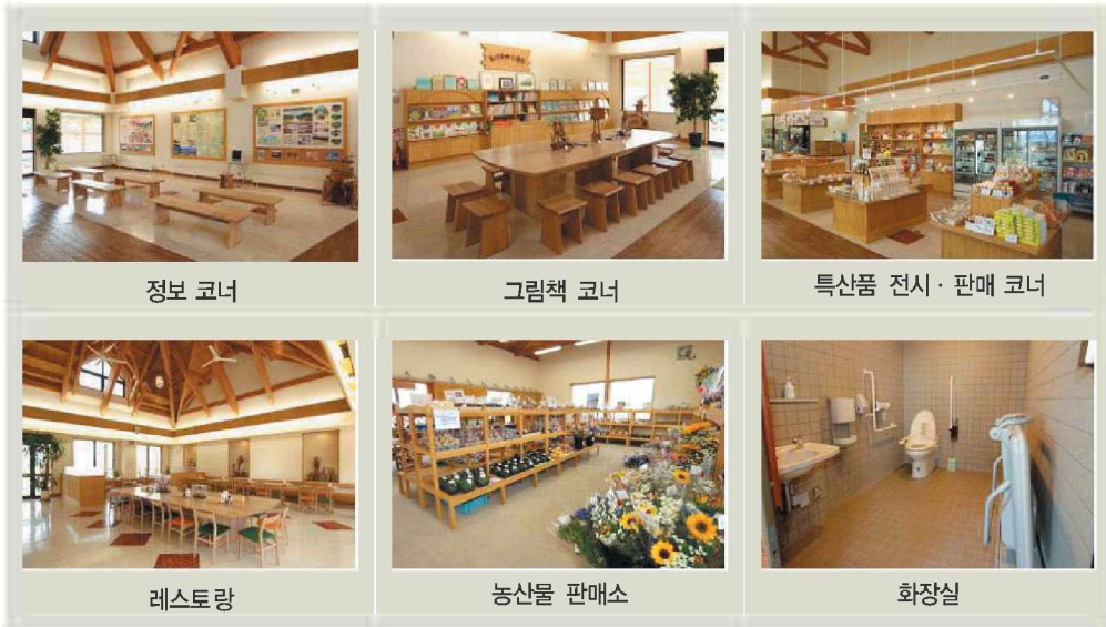
「미찌노 에끼」내의 주요 시설

주변의 대표적인 관광 자원으로는 세계 각국으로부터 수집된 그림책 3만권과 일반도서 1만 5천권이 있는 어린이「그림책 도서관(繪本の館)」이 있어, 연관은 물론 대출도 가능하여 언제라도 감성 풍부한 그림책과 접할 수 있다. 뿐만 아니라 그림책을 이용하여 아이들의 창조력을 기르기 위한 체험 행사도 개최된다.