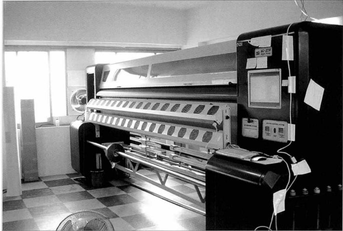
실사출력작업장에 실제 '상크미'를 설치한 모습

진 것이나 마찬가지다. 결과는 성공적이었다. 이전 전시회 때와는 확연하게 달라진 실내 공기에 방문객들은 쾌적한 기분으로 관람할 수 있었다.