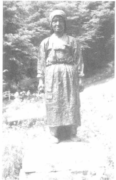
공발 때는 아낙네상 <박철성 작>