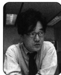
글·김철중 조선일보 의학전문기자