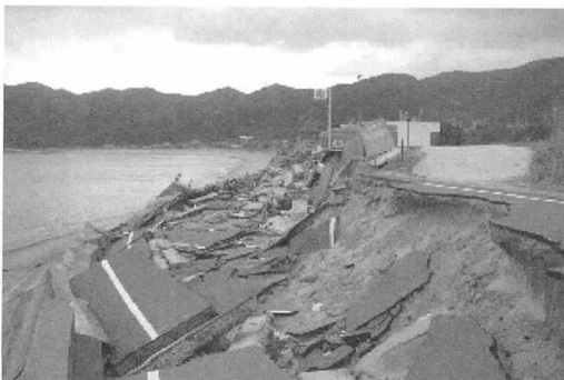
호안, 도로의 피해