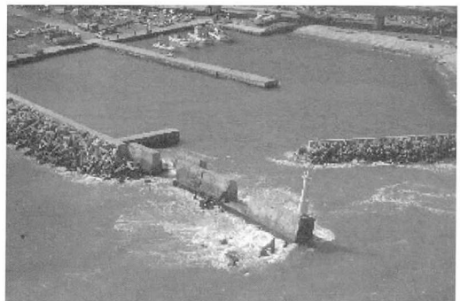
방파제의 피해 (2)