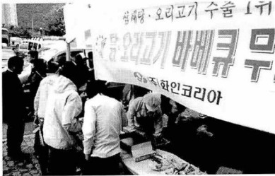
(주)화인코리아가 나주 벨로드롬 사이클 경기장 앞에서 제88회 전국체육대회 참가선수와 임원들에게 무료로 오리고기 바베큐와 닭고기를 제공하고 있다.

오리고기·삼계탕을 수출하는 향토업체 (주)화인코리아가 사이클 경기장인 나주 벨로드롬 경기장