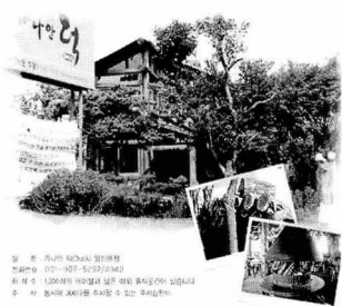
일 산 가나안 덕(일 산 본 점) 전화 번호 031-907-5033(1~34) 주 소 1000원 이하의 단골음료와 함께 제공되는 웰빙 음식입니다. 주 소 1000원 이하의 단골음료와 함께 제공되는 웰빙 음식입니다.

일산의 명물로 자리잡고 있는 가나안덕 일산본점이 결실의 계절 가을을 맞아 가나안덕을 찾는 고객들이 좀 더 편안하게 설