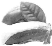
▶ 코리아더커드는 지난해 최첨단 시설을 갖춘 도압장 및 가공장을 준공하고 제2의 도약기를 맞이하고 있다.