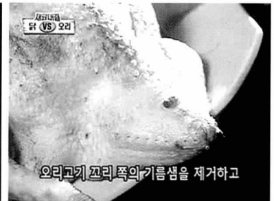
기름샘 제거하면 냄새 없음