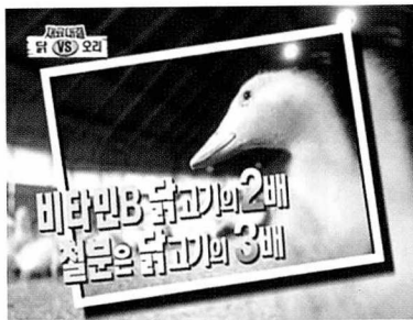
무기질과 비타민이 풍부한 영양만점 오리고기

오리는 필수아미노산을 공급하는 단백질이 풍부하고 육류 중 유일한 알칼리성 식품으로 몸의 산성화를 막아 노화방지에 도움을 주며, 불포화지방산의 함량이 높아 콜레스테롤 생성을 억제해 성인병을 예방해준다. 여기에 비타민 B는 닭고기의 2배, 철분은 3배라고 하니 영양면으로는 이보다 더 훌륭할 수 없다.