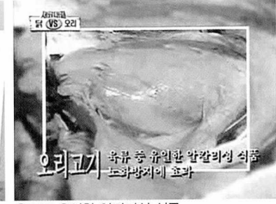
육류중 유일한 알칼리성 식품