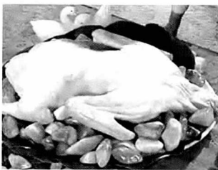
귀한 옥먹고 자란 옥오리

오리고기는 잘 관리하고 요리하면 전혀 냄새가 나지 않는다. 오리고기 꼬리쪽의 기름샘을 제거하고 신선하게 보관하면 냄새는 걱정하지 않아도 된다. 오리고기에 기름이 많은 것은 사실이지만, 고기 살과 기름이 다른 육류에 비해 확연히 분리되어 있어 기름지게 느껴지는데 오리기름은 수용성이면서 불포화지방산 함량이 높아 소화흡수율이 높고