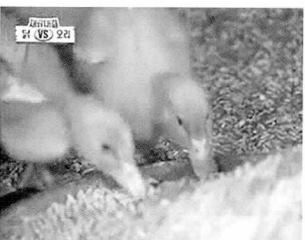
옥가루 먹는 새끼오리들

이렇게 좋은 오리에 유익한 작용을 상승시키기 위해 인삼, 미늘, 녹차 등 귀한 것 먹고 자란 오리들이 많은데 그 중에서도 차원이 다른 명품오리가 있으니 그것이 바로 옥오리이다.