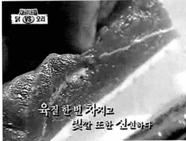
차원이 다른 육질