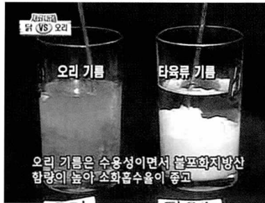
오리기름은 수용성 기름임