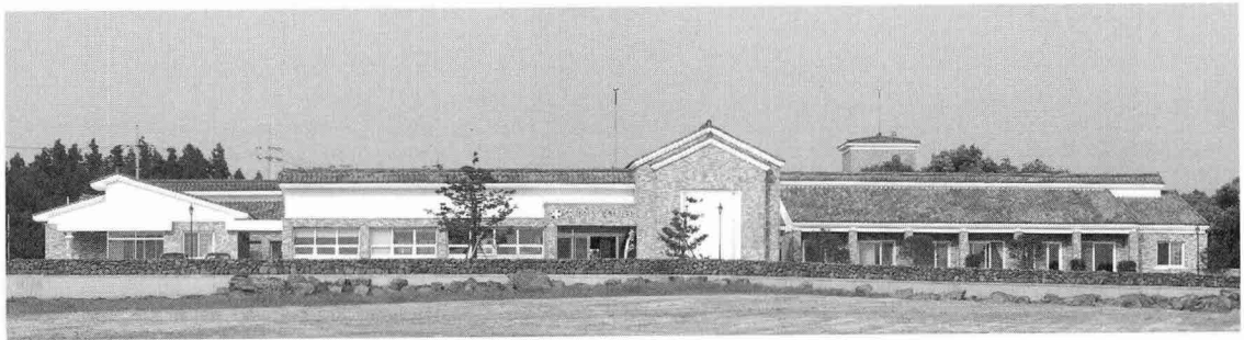
성 이시돌 복지의원 전경

사무실: 064-796-2244, 휴대폰 010-2698-2121, E-mail: lucarta@hanmail.net