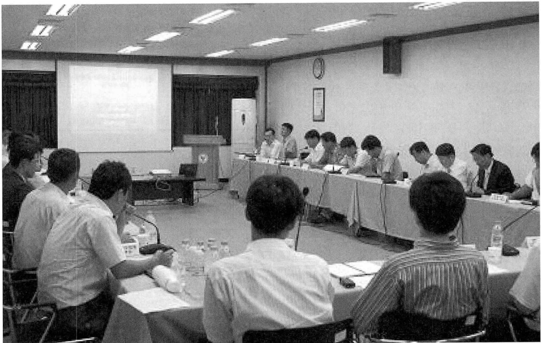
소 농장 평가기준(안) 관계자 설명회 장면

소 농장에 대한 HACCP 도입은 농장주의 의지가 중요하므로 지금부터 평가기준에서 요구한 수준으로 기준서를 작성하여 기록하는 습관을 갖도록 하여야 할 것으로 사료되며, 이번 소농장에 대한 HACCP 적용으로 국민의 주요 식품인 쇠고기 및 우유의 품질과 안전성을 한꺼번에 끌어올려 국민 보건향상에 기여할 것으로 판단된다. 또한 소 농장 HACCP 추진관련 궁금한 사항은 검역원 축산물안전과나 축산물HACCP기준원을 통해 해결할 수 있으므로 양 기관을 활용하면 HACCP 추진에 도움이 될 것으로 사료된다. ☺