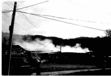
인근 마을 화재진화 활동 지원