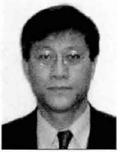
글 | 김성삼 금융감독원 화재조사팀장