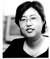
글 | 윤선화 한국생활안전연합 공동대표