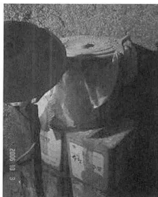
▲ 토굴의 자연원리를 이용한 천연냉장고