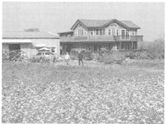
▲ 텃밭 뒤로 펜션과 창고.