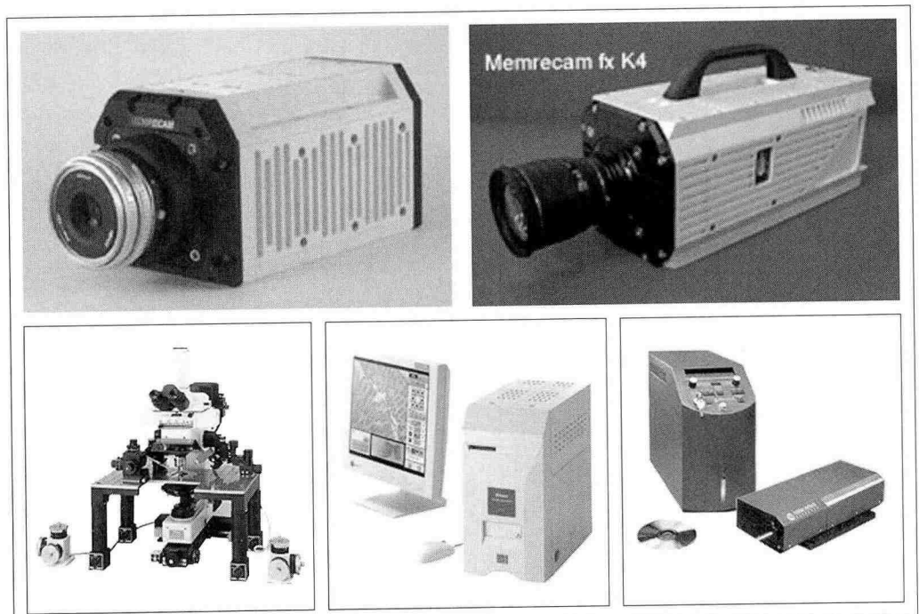
▶ 삼우과학에서 취급하는 연구용 디지털 카메라, 디지털 현미경, 레이저 시스템 등 다양한 제품들

이상길 이사는 "광학이 전자부품이라 할 수 있는데 현재 협회 회원사 분류를 보면 카메라, 복사기, 레이저 등 단품 위주로 분류·구성되어 있다."며 "현재 제품군으로 나뉘져 있는 회원사 분류를 산업군으로 크게 분류하고 여기에 전자, 모듈, 멤스 등 새롭게 다양한 품목의 업체들을 가입시키고 이끌어주는 역할을 해주었으면 한다."고 말했다.