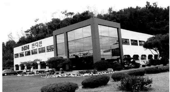
▲ 씨케이테크놀로지 사옥

씨케이테크놀로지는 올 상반기 대외적인 시장 환경 때문에 적지 않은 마음고생을 한 게 사실이다. 신권 지폐식별기 시장이 당연히 품질 경쟁력위주로 평가를 받을 것으로 보았으나 저가격 위주의 가격 경쟁력을 갖춘 제품의 위세는 의외로 대단했다. 시장이 불황이다 보니 시장의 니즈가 가격이 싼 제품으로 많이 쏠렸던 것. 물론 가격도 싸고 품질의 신뢰성도 뛰어난 제품이 경쟁우위에 서는 것은 자연스러운 시장의 논리이다. 하지만 문제는 품질에 대한 면밀한 검토 없이 가격 싼 제품을 선호하는 시장 분위기가 확산되고 있는 점이었다. 상대적으로 가격이 비싸고 품질이 좋은 씨케이테크놀로지의 NBX-5000K시리즈의 경우, 이러한 분위기가 원망스러울 수밖에 없었다. 이러한 가운데 위폐인식 신권지폐식별기 문제가 터졌다. 매스컴에 이 문제가 대대적으로 보도가 되었고, 자