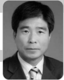
양 회 명