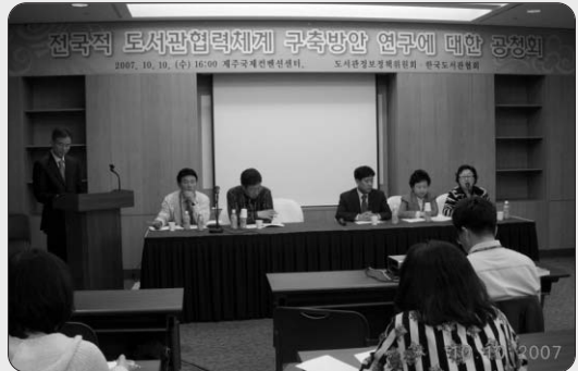
[기사 및 사진 제공 : 도서관정보정책기획단]