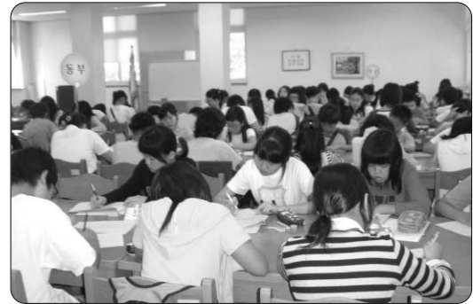
(제25회 어린이글짓기대회 전경)

서울시립어린이도서관은 서울시 초등학교 6학년 어린이들을 대상으로 9월 17일(월) 제25회 어린이 글짓기대회를 개최했다.