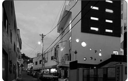
<느티나무도서관 전경, 사진출처: 책읽는사회만들기국민운동 홈페이지>

10월 20일(토) 부산광역시 해운대구 반송2동에 또 하나의 새로운 도서관이 개관했다. 작년부터 반송동 주민들이 애지중지 보물처럼 여기며 공사를 진행해 온 도서관이 완공되어 '느티나무도서관'이라는 이름으로 서비스를 시작했다.