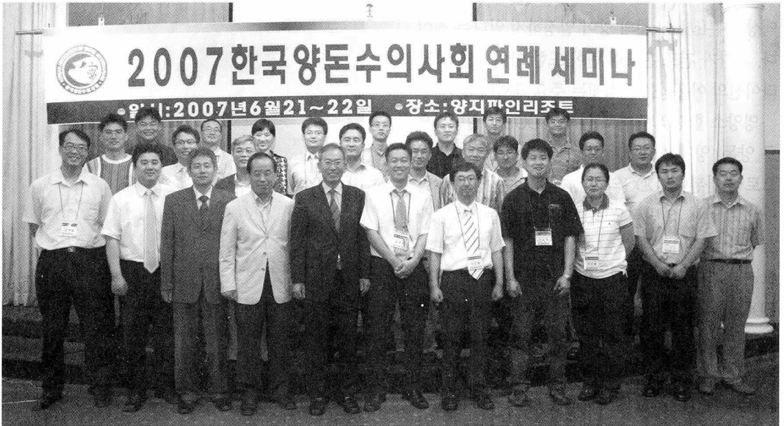
▲ 이틀간의 세미나 일정이 끝나고 한국양돈수의사회 연례세미나를 기념하여 단체기념사진을 촬영했다.