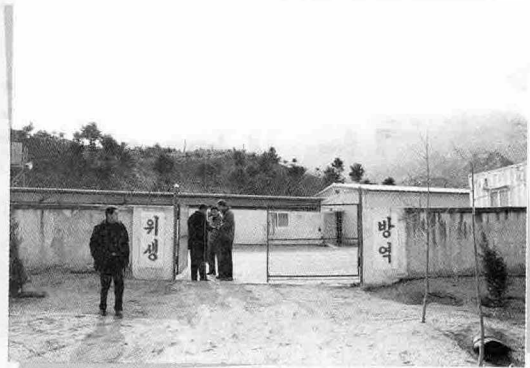
▲ 성북리 양돈장에 농장 입구 모습

북한 양돈 관계자는 “처음에 남한 돼지를 보고 물소인 줄 알고 깜짝 놀랐다. 예전에 비해 효율적