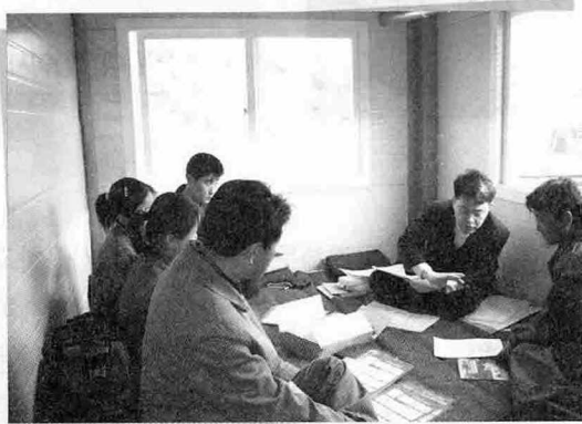
▲ 이번 금천리 양돈장에 입식한 종돈 56두에 대한 사양관리 및 전산관리 등을 설명하고 있다.