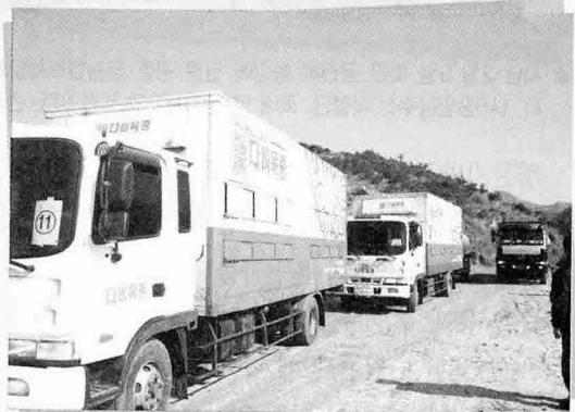
▲ 종돈 56두가 입식을 위해 금천리 양돈장에 들어오는 모습

인 관리로 두배로 생산성이 높아져 일하는 것도 즐겁다.”며 소감을 말했다.