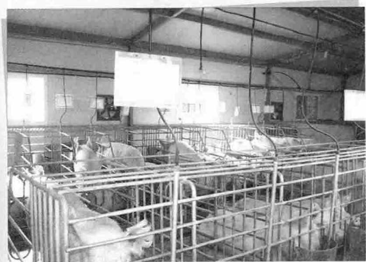
▲ 성북리 양돈장은 환기시설과 전열시설이 국내 못지 않게 갖춰져 있지만 전력 부족으로 제대로 활용하지 못하고 있다.