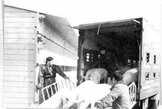
▲ (주)다비육종의 종돈들이 북한 금천리 양돈장에 첫발을 내딛는 순간