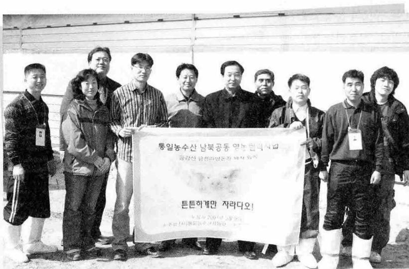
▲ 지난 3월 9일 북한 금천리 농장에 남북 공동 영농협력사업의 일환으로 종돈 56두가 수출되었 다. (사)통일농수산 사업단, 국내 양돈 관계자와 북한 양돈 관계자들과의 입식 기념촬영

다. 이번 사업은 2005년 부터 올해까지 3년동안 진행되고 있으며 북한 사람들 식생활에 도움을 주고 양돈산업의 생산성 을 높여 국내 양돈산업 과의 협력을 도모함에 있다.