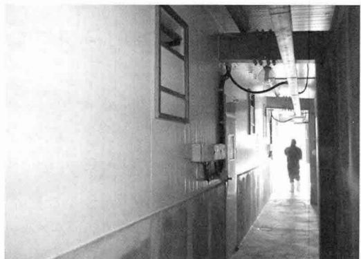
▲ 완벽한 단열시공과 함께 첨단 보온등 컨트롤러를 사용해 섬세한 난방, 온도조절이 가능하다.