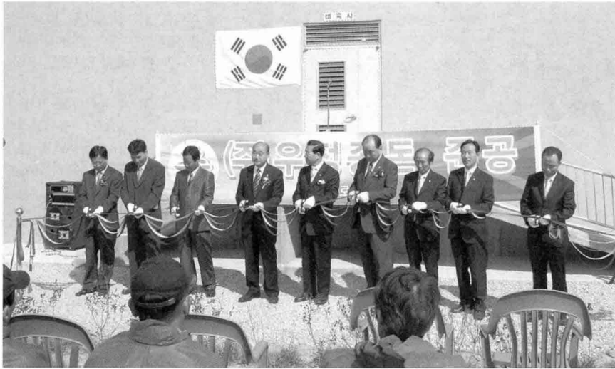
◀ 우정종돈은 지난 10월 16일 양돈농가와 양돈 관계자들 200여명이 참석한 가운데 친환경 최신식 무창돈사 시설인 우정종돈 김제 GGP 농장 준공식과 농장개방 행사를 개최했다.

성돈군 확보와 환경과 조화로운 축사시설을 통해 경쟁력 확보를 할 수 있도록 주안점을 두었다”고 밝혔다.