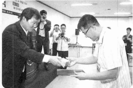
■ 대회장상 햄프셔공업사

박람회 마지막날인 지난 9월 14일 열린 우수전시업체 시상식에서 자동급이기 전문기업인 성광시스템이 최우수 전시업체로 선정, 국무총리상 수상의 영예를 안았다.