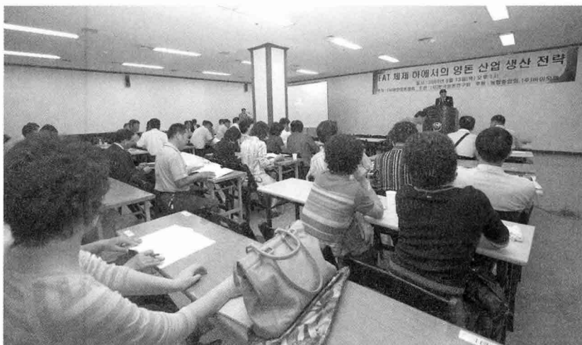
▲ KOTREX 제1전시관 지하 세미나실에서 대한양돈협회 주최, 한국양돈연구회 주관 'FTA 체제 하에서의 양돈산업 생존전략' 세미나가 개최됐다.