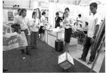
▲ 다트게임과 함께 황금돼지 주사위 던위 맞추기 다트. 지기 등 다양한 이벤트가 열렸다.

에 대한 소개, 국산 돼지고기에 대한 소개가 전시됐으며, 안심·등심·뒷다리살 황금부