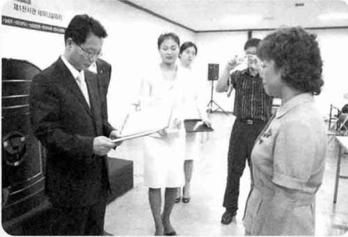
■ 국무총리상 성광시스템