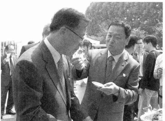
▲ 임상규 장관이 돼지고기 시식회장을 방문하여 국산 돼지고기를 맛보고 있다.