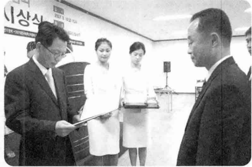
■ 장관상 유로하우징