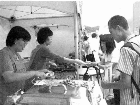
▲ 박람회 기간중 양돈자조금사업의 일환으로 국산 돼지고기 시식회가 열려 소비자들로부터 호응을 얻었다.