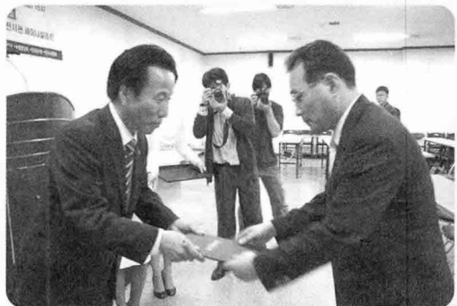
■ 대회장상 대성미생물연구소

우수전시업체는 다음과 같다. 국무총리상 '성광시스템', 장관상 '유로하우징', '삼성산업', '은혜축산기계', 대회장상 '동진레벨', '안성공업', '햄프셔공업사', 'TS현대축산', '삼우엔지니어링', '라이브맥', '대성미생물연구소', 특별상 '천하제일사료', '파소텍', '제일함석'.