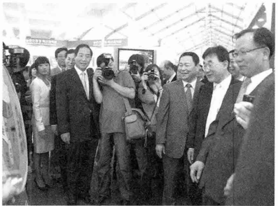
▲ 양돈홍보관 국산 돼지고기 황금부위 맞추기 다트게임 이벤트에 참가한 임상규 농림부 장관