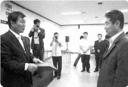
■ 대회장상 안성공업