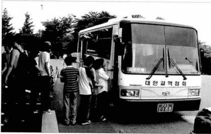
참가하여 행사를 지원했다.

행사의 일환으로 대덕대학교 내에서 재학생 365명에 대한 무료 X-선검진을 실시했으며, 결핵을 알리는 패넌을 전시하는 등 지역민에게 결핵을 바로 알리기 위한 홍보활동을 펼쳤다. (소식_김경환 대전·충남지부 행정지원팀)