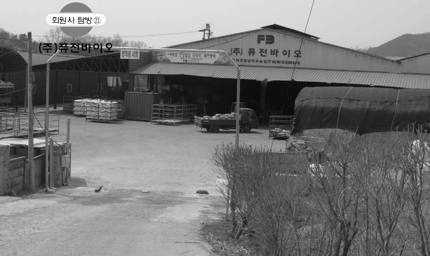
▲ (주)퓨전바이오 공장전경