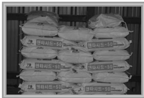
엔타시드-50 ▶ 퓨전바이오의 제품들 ▶▶