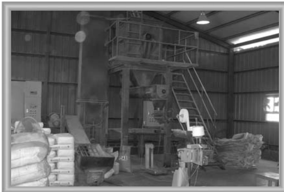
▲ 첨가제 생산라인(발효사료기)

비교해서 육성률, 성장률, 사료효율, 폐사율 등 차이가 없었으며 특히 우려되는 콕시듐, 호흡기, 설사 등의 질병이 나타나지 않는 성과를 거뒀다.”라며 힘찬 자신감과 자부심을 표명했다.