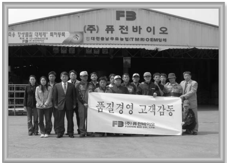
퓨전바이오 임직원 ▶

이러한 노력 등의 결실로 올해에는 유럽(네덜란드)으로 보조사료, 첨가제 등을 수출할 계획을 밝힌 (주)퓨전바이오. 논산의 기운이 국내를 벗어나 세계로 뻗어나가길 기대해 본다.