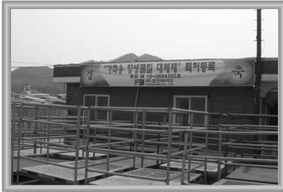
▲ “가축용 항생제 대체 물질” 특허등록 플랜카드