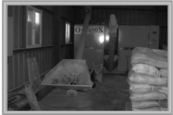
▲ 첨가제 생산라인(믹서기)