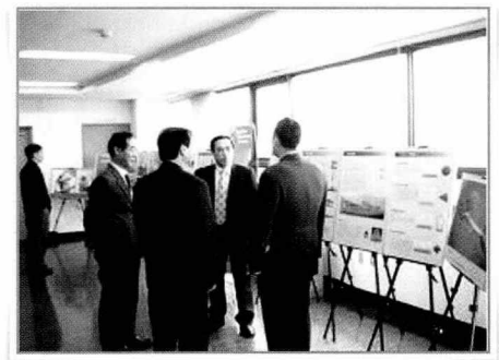
- 웅진수협에서 개최된 해양사고예방사진전 -

협회 인천지부는 공단설립기념 해양사고예방사진전을 관내 수협 등에서 개최하고 있다.