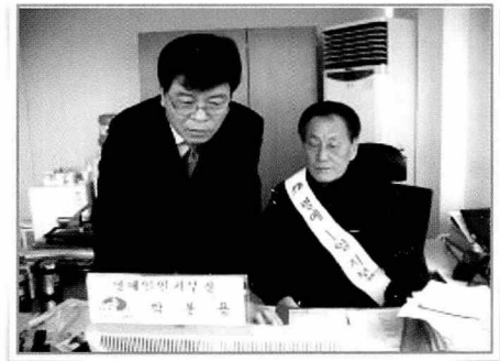
- 명예일일지부장 체험 -

협회 군산지부에서는 관내 어촌계장을 대상으로 명예 일일 지부장 및 명예일일검사원 체험을 실시하였다.