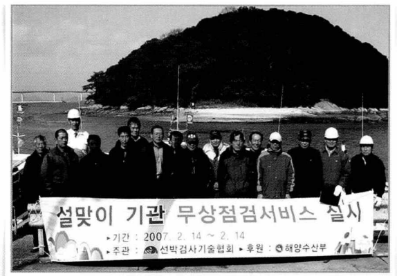
- 어선기관 무상점검서비스 실시 -

이번 무상점검서비스는 해양수산부의 후원으로 명절 대목을 위해 출어를 준비중인 어선의 기관을 사전에 점검하여 점검불량에 의한 해양사고를 미연에 방지하고자 계획되었으며, 정비경험이 풍부한 지역의 기관정비업체들과 합동으로 기관점검을 실시하는 한편 기관실 시설물, 안전운항 및 인명구조장비, 기관, 전기설비 상태등을 점검하고 폐기관단열재, 부동액, 냉각수첨가제 및 작동되지 않는 항해등용 전구를 무료로 교환해주고 선박에 필요한 비품들을 전달하는 등의 점검서비스로 지역 어민들로부터 호평을 받았다.