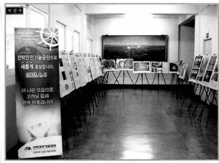
- 인천지부 현관에 개최중인 사진전 모습 -

이번 사진전에는 안전의식 고취를 위해 해양사고사례와 선박안전관련 선용품 등 사진 37점과 공단설립 및 사진전 개최 홍보물 3점 등 총 40여점의 홍보물이 전시되며 어업인, 선박관련종사, 선박이용여객, 미래고객(해양수산관련 학교 재학생)등을 대상으로 공단설립일인 2007년 4월 4일 전후 까지 개최한다.