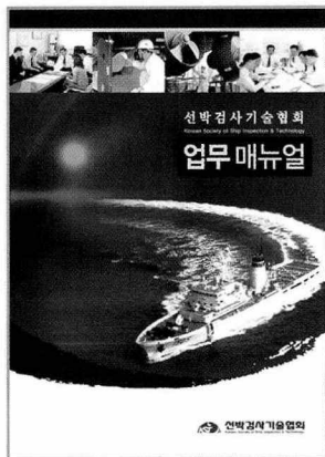
- 업무매뉴얼 -

선박검사기술협회(이사장 김성규)는 지난 2월 16일 팀 · 지부별 소관업무의 처리 절차, 방법 및 운영 등에 대한 구체적이고 실천적인 사항을 담은 “업무매뉴얼”을 발간하였다.