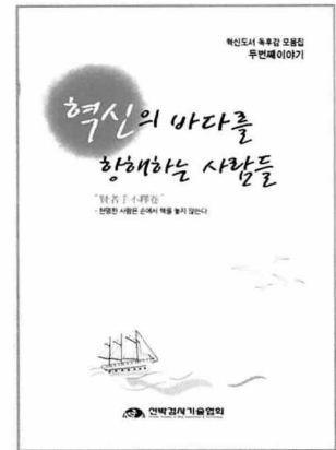
- 혁신학습 독후감 모음집 -

협회가 이번에 발간한 독후감 모음집은 지난해 전지부로까지 확대 실시한 혁신학습토론회에서 발표된 혁신도서 독후감 총122편중 32편을 엄선한 것으로써, "혁신의 바다를 향해하는 사람들"이라는 주제로 성공전략, 자기개발, 리더십, 조직/일반, 기타 등 5개 분야로 분류하여 불확실한 미래에 대한 위기관리 능력과 미래 지속성장을 위한 핵심역량 배양의 길잡이가 될 수 있는 도서들로 구성하였다.