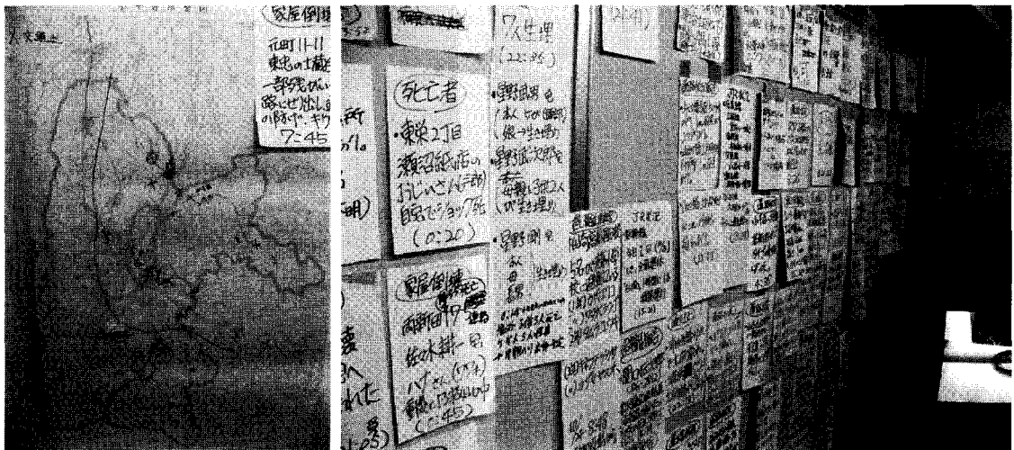
그림 1. 오지야(小千谷)시청 재해대책본부 상황판