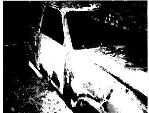
Fig. 2. A burnt out car used by a man later convicted of having stabbed his wife to death (Pye, 2005).

훼손되거나 재검사를 고려할 때 가능한 많은 시료를 확보하고 분석 시 사용될 시료의 양과 보관용 시료의 양을 조절할 필요가 있다.