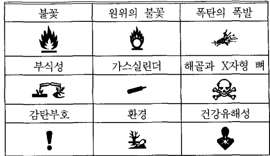
Table 1. The symbols of GHS

에 붙이거나 인쇄 또는 첨부되는 것을 말한다. GHS의 위험유해성 클래스와 구분에 관한 정보를 전달하기 위해서 경고어, 심벌, 그림문자, 위험유해성정보, 사전주의문구, 제품과 공급자 고유의 정보가 표기된다(Table 1).