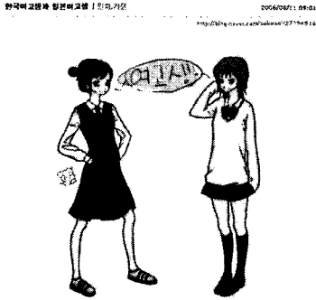
<그림 5> 한국 여고생과 일본 여고생 46)

한편, 여성 신체의 특정 부위를 강조하기 위해 특정 부위를 피트 시키거나 노출하는 것의 여러 방법들은 서양복에서 “여성적” 복식의 요소가 되어 왔다. 피트 되는 부위나 노출의 부위는 시대마다 다르게 나타났고, 이것으로부터 당시 여성이 강조하는 부위와 여성적인 이미지를 주는 요소들이 변화되어 왔다. 47) 이러한 시대별 차이점은, 한국이나 일본과 같이 서양복을 받아들인 아시아의 문화적 특성과 함께 또 다른 의미로 받아들여졌을 가능성이 높다. 즉, 특정 부위의 강조나 노출은 한 문화에서는 매력적이고 트렌디하게 받아들여지는 반면, 다른 문화에서는 용인할 수 없는 요소로 받아들여지기도 하는 것이다. 예를 들어, 일본의 짧은 교복 스커트에 대해 한국 고등학생들은 다음과 같은 반응을 보인다.