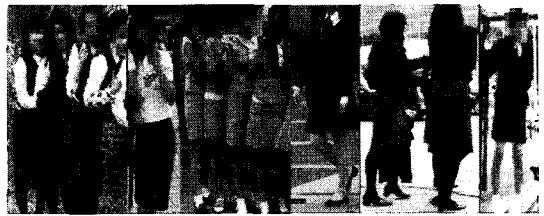
〈그림 3〉 한국 여학생의 실제 교복 착용 모습 44)

는 보다 슬림 하고 몸에 피트 되는 스타일로 여성적이고 날씬해 보이는 룩(look)을 추구하고(그림 3), 대부분 짧은 양말 또는 스타킹과 함께 착용하고 있었고, 일본의 교복 사진에서는 상의는 박스형 스타일에 하의는 훨씬 짧은 플리츠 스타일로 대부분 목이 긴 양말 또는 루즈 삭스(loose socks)와 함께 착용하는 모습들을 발견하였다(그림 4). 콘노 오유키의 소설 “마리아님이 보고 계셔 マリア様がみてる”는 사립 여고를 배경으로 하는데, 교복에 대해서 “요즘 들어서는 보기 드문 무릎 아래까지 내려오는 긴 치마길이...” 43) 라고 언급하고 있어, 짧은 스커트 교복이 만연하고 있음을 보여준다.