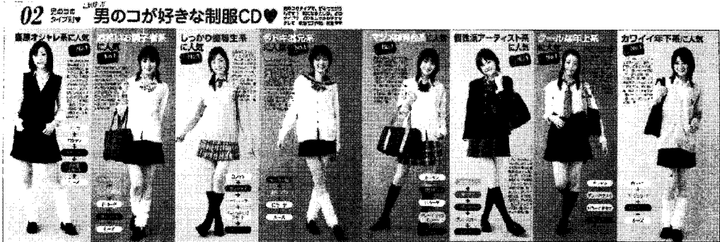
〈그림 2〉 "남학생이 좋아하는 교복 스타일" 36)