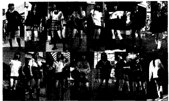
〈그림 4〉 일본 여학생의 실제 교복 착용 모습 45)

이처럼 서울과 도쿄 여고생의 교복이 실루엣에서 많이 차이가 나는 것은 서울과 도쿄의 여러 가지 문화적 차이에서 오는 것으로 판단할 수 있다. 앞서 언급하였듯이, 학교문화와 관련하여 한국과 일본의 청소년들이 ‘집단따돌림’을 가장 큰 학교 폭력으로 인식하고 있는 것은 다른 연령대에 비해 높은 동조성을 보이는 청소년들의 특성과 맞물려 더 높은 동조성을 보여주는 것이라고 볼 수 있는데, 이와 같은 높은 동조성으로 한국 교복 스타일과 일본 교복 스타