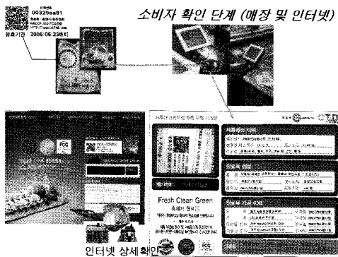
그림 4 웹 구현 이력정보 사례 fig 4 Web Implementation case

농업생산 기술의 발달과 외국인 농산물의 수입 증가 등으로 농산물도 수요에 비해 공급과잉의 시대가 되었다. 이제는 농민들이 생산량을 늘리는 일에만 전념할 것이 아니라, 안전 식품 선호 등 달라진 소비자의 기호 및 소비 성향을