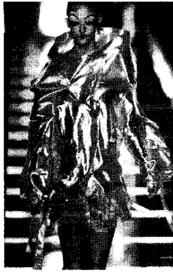
〈그림 2〉 몽상과 관능의 해학, 극적인 대조의 결합 Collezioni No. 92, p. 401.