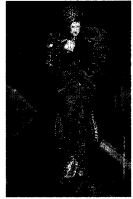
〈그림 4〉 몽상과 웃음의 오페라적 결합 Collezioni No. 102, p. 179.

표현되었다. 이러한 디자인이미지와 패션메이크업과는 달리 경쾌한 음악에 맞춰 무대에 등장한 모습이 마치 '공주병에 걸린 공주'로, 역사적인 요소와 현대적인 요소가 병치됨에 따라 시·공간이 해체되어 내용이 반전된 오만방자한 웃음 속에 낭만적인 요소와 사치스러움이 내포된 디자인이미지와 패션메이크업을 몽상과 웃음의 오페라적 결합으로 해석된다. 이는 경쾌한 음악이 흐르는 판타지 랜드 속의 모델들이 동화 속의 요정처럼 순수하고 평화로운 얼굴들로 연출된 것이 더욱 극적인 반전을 부각시키기 위함이라 사려된다.