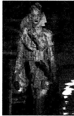
〈그림 11〉 비운과 감상의 극적인 결합 Collezioni No. 112, p. 158.