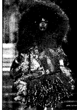
〈그림 7〉환상과 해학의 과장적 결합 Collezioni No. 92, p. 411.