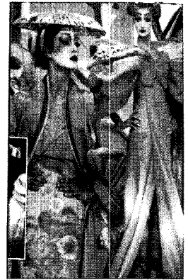
〈그림 12〉 몽상과 관능의 오페라적 결합 ELLE No. 9, p. 355.

을 자신 특유의 패턴 커팅과 여러 문화와 역사가 혼합된 독창적이고 정교한 솜씨를 보여주었다. 무대