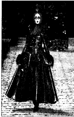
〈그림 10〉 해학의 악마적 표현 www.style.com