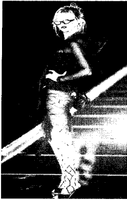
〈그림 9〉 관능과 해학의 극단적 결합 Collezioni No. 81, p. 221.