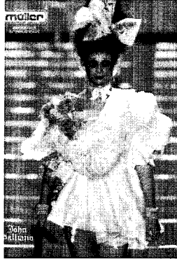
〈그림 6〉해학과 감상의 반전된 결합 Collezioni No. 98, p. 226.