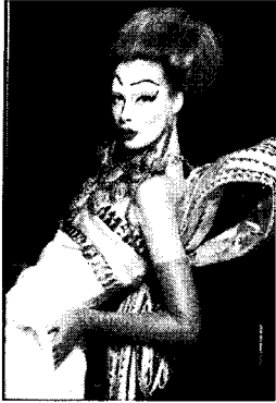
〈그림 5〉해학과 몽상의 신하적 결합 Collezioni No. 99, p. 191.