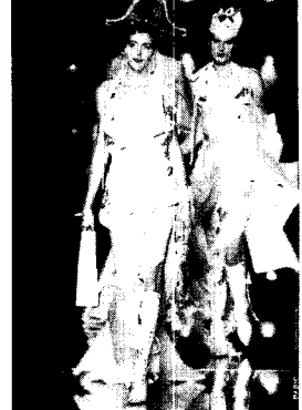
〈그림 8〉관능, 해학과 환상의 관계적 결합 Collezioni No. 75, p. 179.

있다. 즉 어릿광대처럼 마치 눈물을 흘리고 있지만 우스꽝스러운 웃음을 자아내기라도 하듯이 굵은 눈물 자국이 흘러내리는 모델의 눈 화장과 밝은 립스틱 등에서 슬픔감상에 빠진 에로틱한 자기 연민을 과시하듯 울기에는 멧쩍은 모습이 코믹하게 표현되었다.