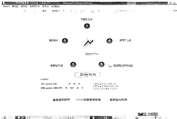
Figure 2. Initial page of web-based statistical program for communicable diseases. ( http://stat.cdc.go.kr )

통하여 수집된 자료는 각종 주보, 월보, 연보, 보도자료 등의 환류자료로 작성하여 전염병정보망( http://dis.cdc.go.kr )을 통하여 모든 국민에게 제공되고 있다.