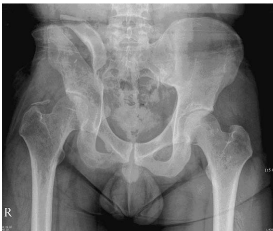
Fig. 2. Post-op anteroposterior view shows right iliac bone disconnected after resection of tumor tissue.

여 광범위 절제 수술을 계획하였다. 피부절개는 전 상장골극에서 장골연을 따라 후하장골극까지 연장하였으며, 병소의 접근은 장골 내외측으로 병행하였다. 중둔근, 소둔근, 장골근을 비롯하여 장골의 종괴 주변부, 천골의 일부를 포함하는 광범위 절제술을 시행하였다(Fig. 2). 절제된 종괴는 육안적으로는 회백색의 고형성분으로 구성되었으며, 점액성과 낭포성의 변화를 가지고 있었다. 병리조직학적 소견상 방추상 세포(spindle cell)의 고급성 육종 형태를 나타내었고, 면역조직화학 검사상 S-100, Cytokeratin, EMA, Cam5.2, AE1에는 음성 반응을 보였으나, Vimentin, CD34, CD99, C-kit에 양성 반응을 나타내었다. 미분화 활막육종, 악성 말초신경초 종양, 미분화 섬유육종과도 감별을 해야 하지만, 특별히 CD34, C-kit에 양성 반응을 나타내어 위장관 간질 종양이 위장관 및 복부외에 발생한