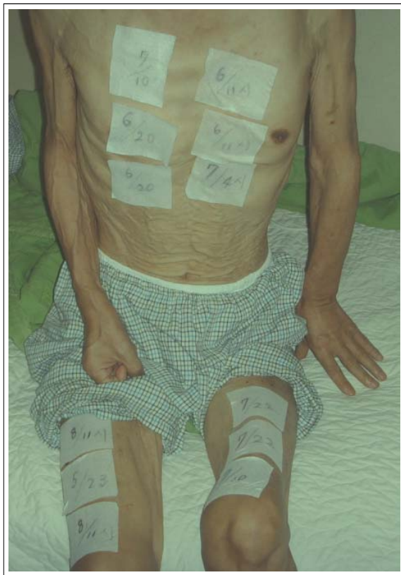
Figure 2. Twelve patches of transdermal fentanyl (Durogesic D-trans® 50µg/hr) applied to patient's skin

단되었다(Figure 1). 병기 결정 수기로 복부 초음파검사, 뇌 자기공명영상 및 양전자방출단층촬영술 등이 시행되었고, 임상적 병기는 IIIA(T3N2M0)로 판단되었다. 세로칸내시경술 등의 추가 검사와 치료를 권고하였으나 환자는 더 이상의 진단적 과정 및 치료를 원치 않았고, 보존적 치료만 하기로 하고 퇴원하였다.